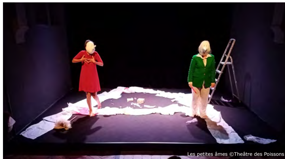
Les petites âmes